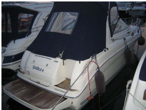
Sea Ray 275 Sundancer